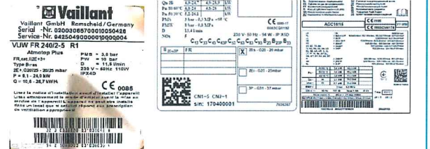
* Exemples de plaques signalétiques

Cet auto-inventaire, s'il est complet, vous évitera la visite d'un technicien à domicile.